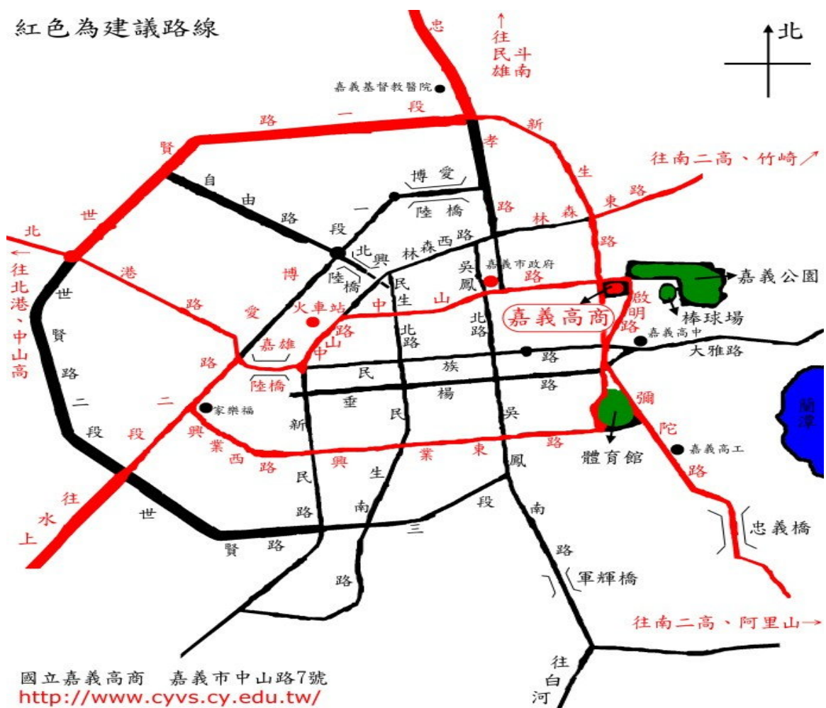
國立嘉義高級商業職業學校 位置圖